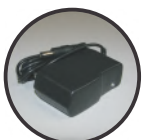
Carregador de bateria 110/220 (bivolt)