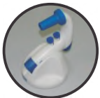
Suporte para Bancada