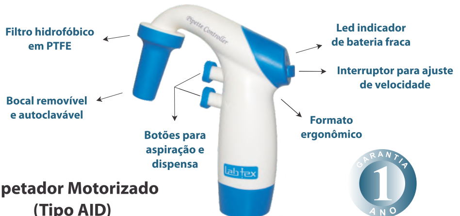
Pipetador Motorizado (Tipo AID)