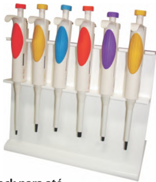
Rack para até 6 Micropipetas monocanal