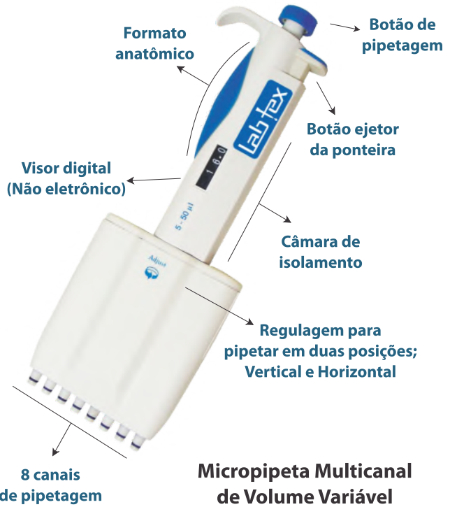
Micropipeta Multicanal de Volume Variável