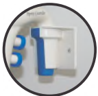
Suporte auto-adesivo para fixação